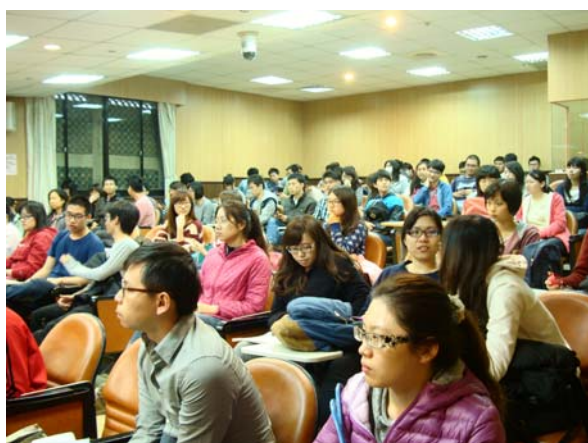
參加活動的同學們