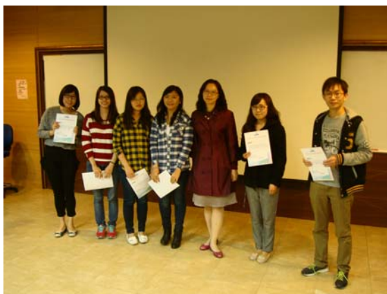
卓越師資 培育獎學 金 頒獎