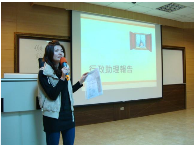
行政人員-硯羚 報告