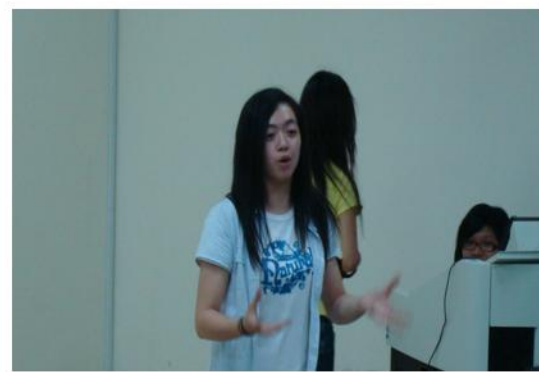
教育學會會長感言